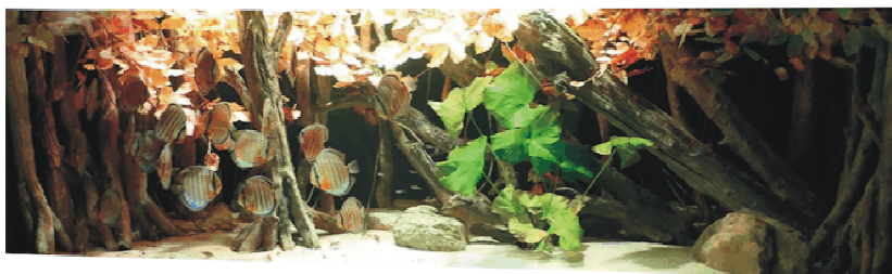
Het aquarium van Alfred-Kiers